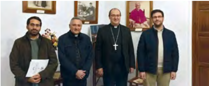
En la imagen el nuevo equipo de la Escuela Cofrade junto al obispo diocesano

El Curso Básico de Formación Cofrade se impartirá en Cáceres a partir del mes de octubre. Ya está abierto el plazo de inscripción.