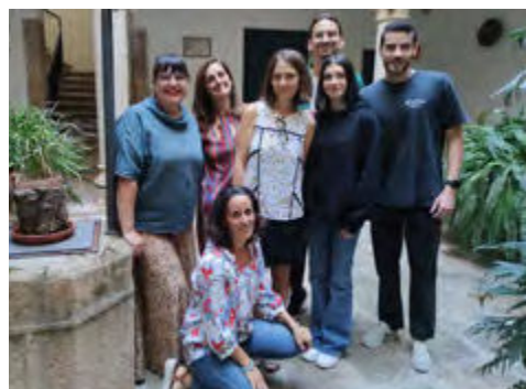
Equipo de Cáritas del Plan Vital de Inclusión

Cáritas Diocesana de Coria-Cáceres participa en el proyecto de implementación de la Metodología del Plan Vital de Inclusión Social.