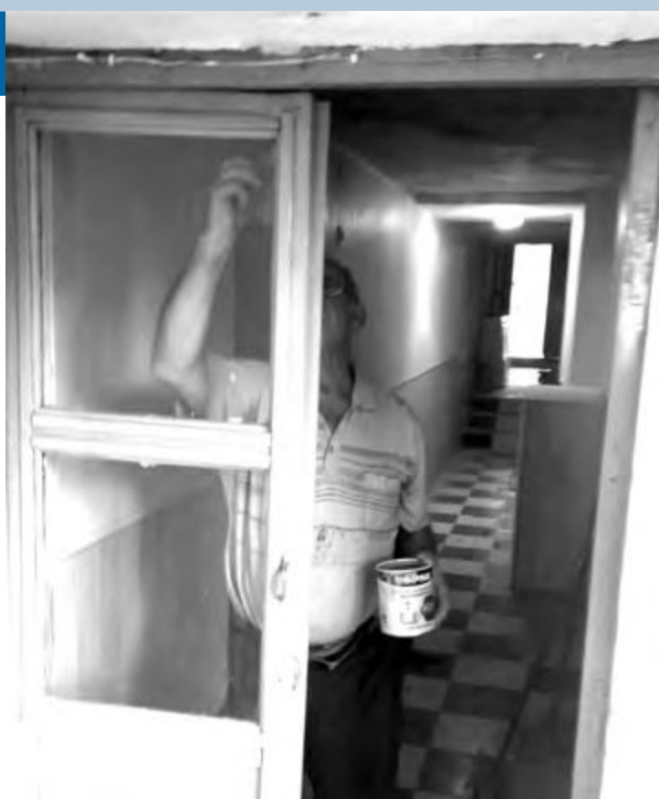
Pintando la casa parroquial

trabajo, con ilusión, se hacen las cosas. Nos está sirviendo como distracción».